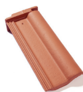
taška pultová půlená