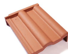
taška pultová krajová pravá