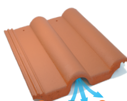
taška větrací ŠTĚRBINOVÉ VĚTRÁNÍ