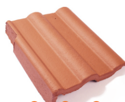
taška krajová levá