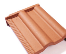
taška pultová krajová pravá