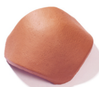
hřebenáč rozdělovací - Y