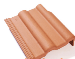
taška krajová pravá