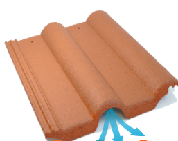
taška větrací ŠTĚRBINOVÉ VĚTRÁNÍ