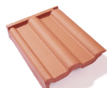
taška pultová krajová levá