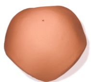
hřebenáč rozdělovací - XS stanový