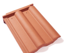
taška pultová základní