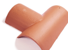
hřebenáč rozdělovací - T levý