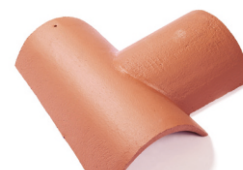
hřebenáč rozdělovací - T pravý