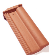
taška pultová půlená